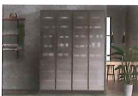
周辺収納・スタイリッシュ