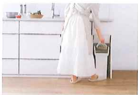
ホーローきれいエリア