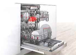
海外製食器洗機・ボッシュ