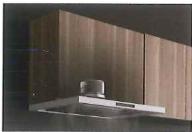
キープクリーンフード